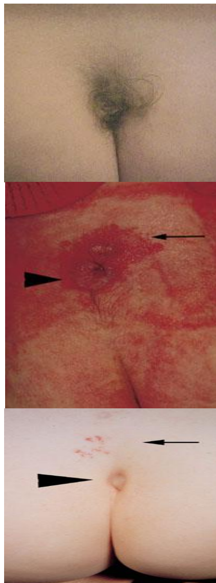
Picture 2. Spina bifida occulta