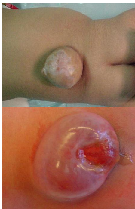
Picture 3. Spina bifida aperta

Intrauterino postavljena dijagnoza je najznačajnija.