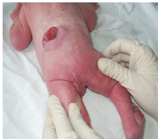
Picture 4. Our patient with SB